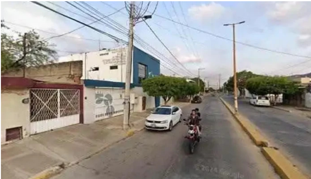
Clinica imagensur promociondeg