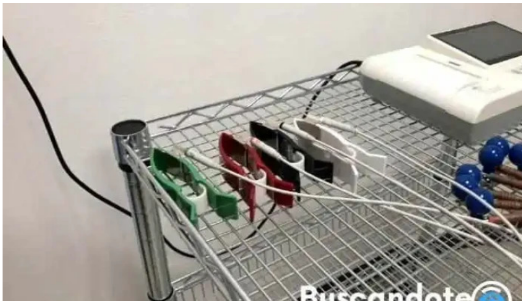
Clinica imagensur del propietario