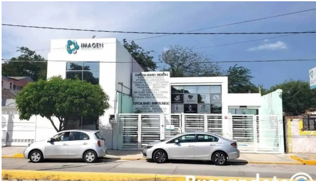
Clinica imagensur cdad ixtepec