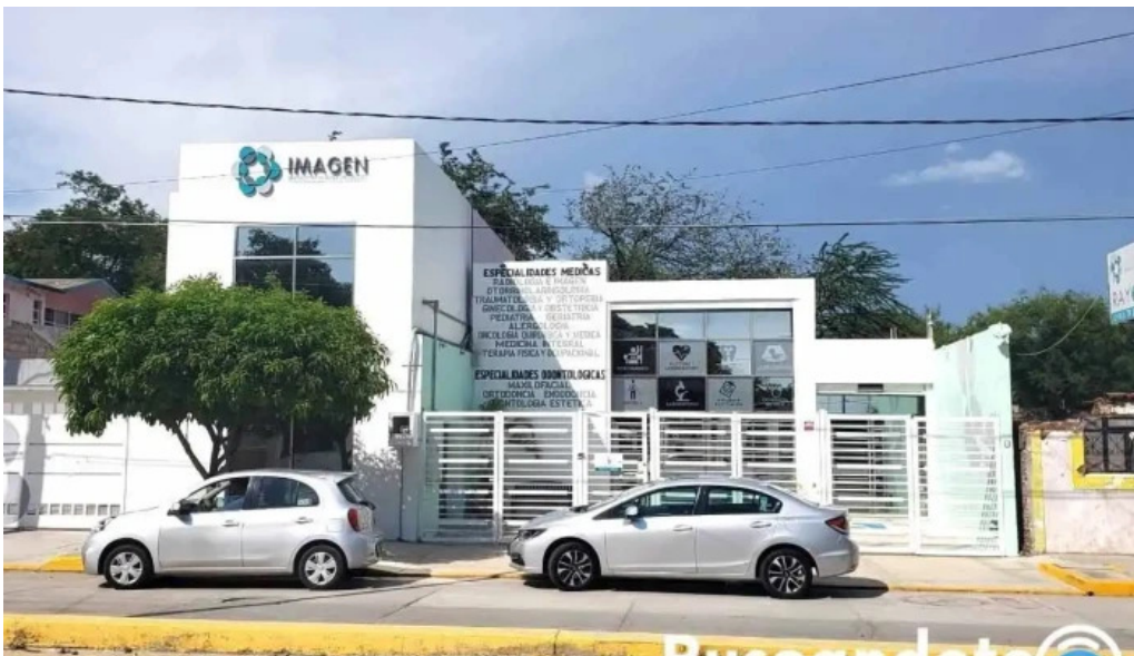
Clinica imagensur promocion