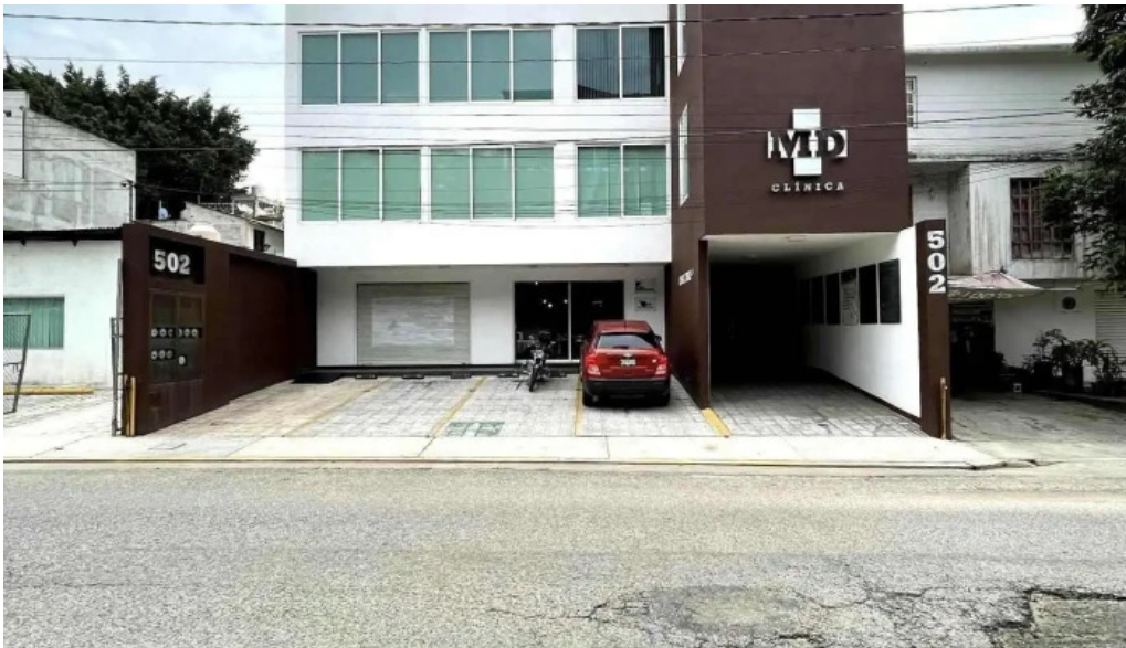
Md clinica telefono