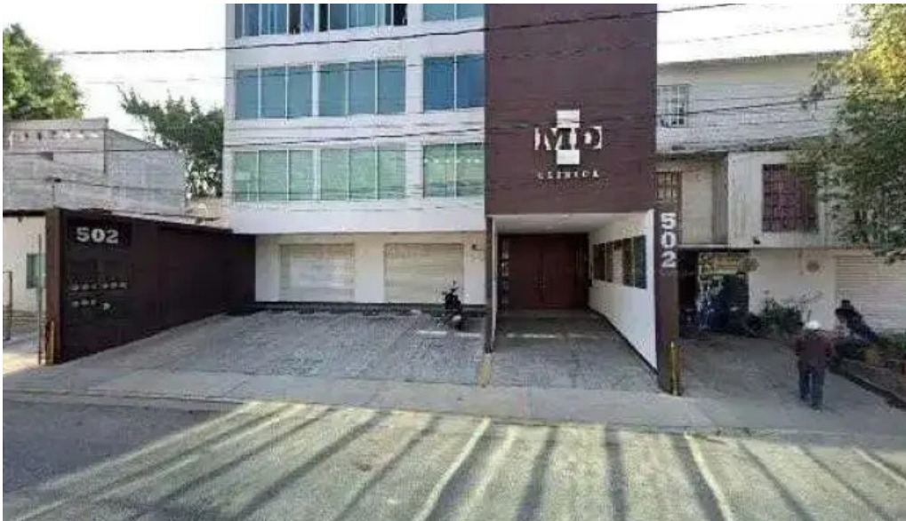
Md clinica telefonodeg