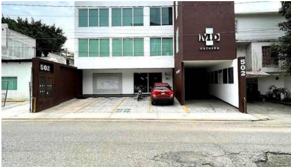
Md clinica oaxaca de juarez