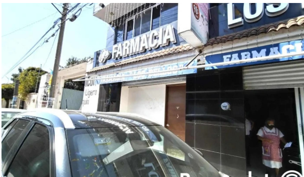
Consultorio medico y dental los bellos videos