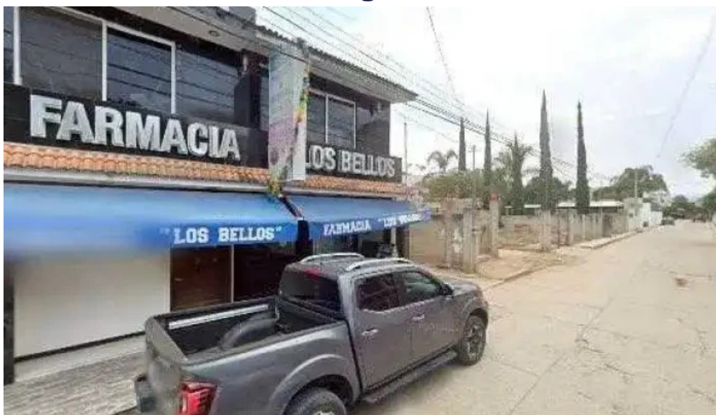
Consultorio medico y dental los bellos videosdeg