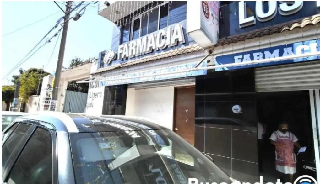
Consultorio medico y dental los bellos nazareno etla