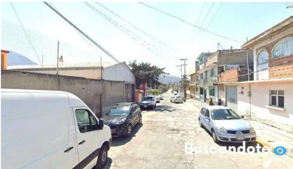
De todos seguire tus pasos buenavista