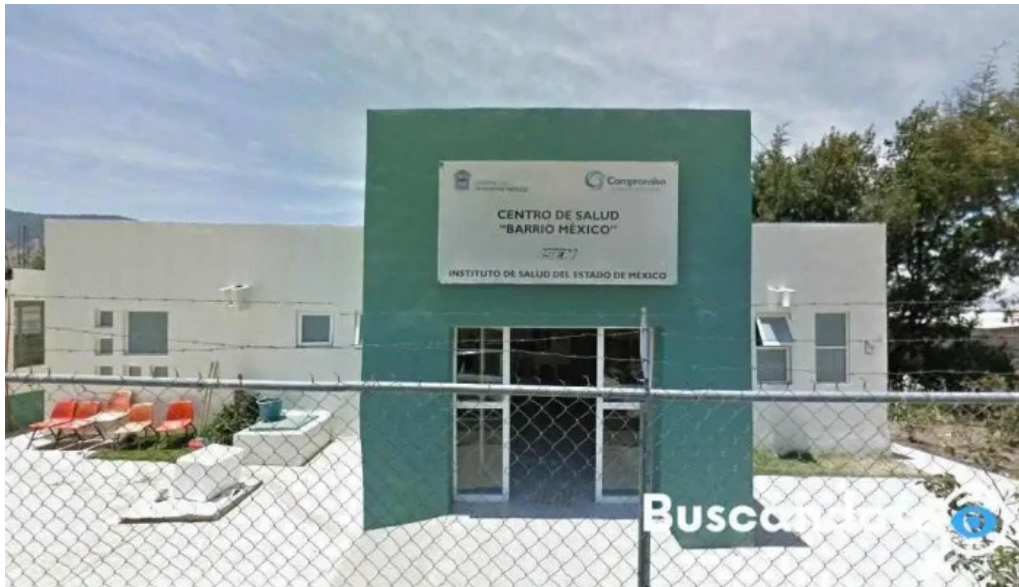
Centro de salud bo de mexico barrio de mexico