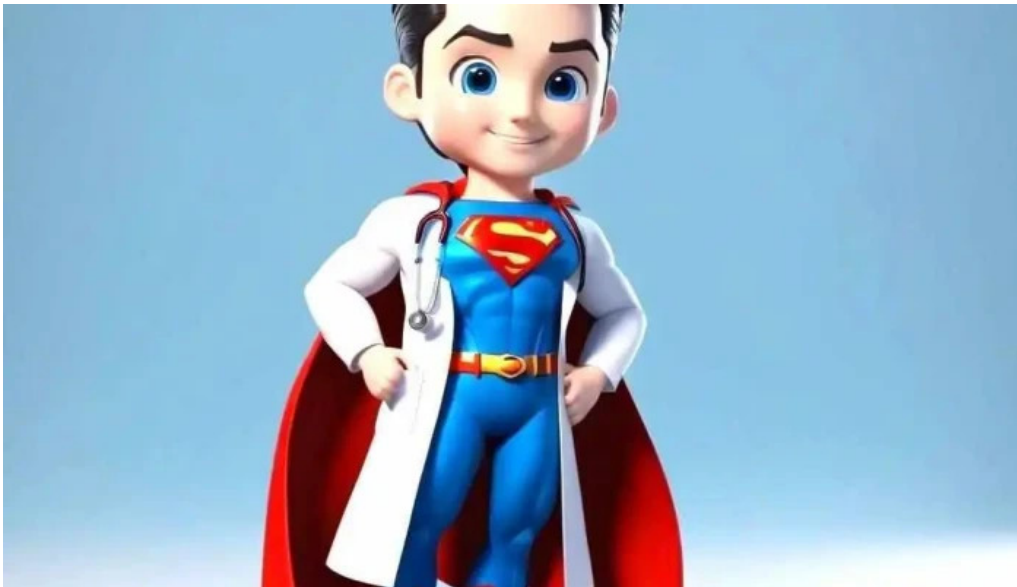
Consultorio medico dr rdolfo aguirre valentin gomez farias