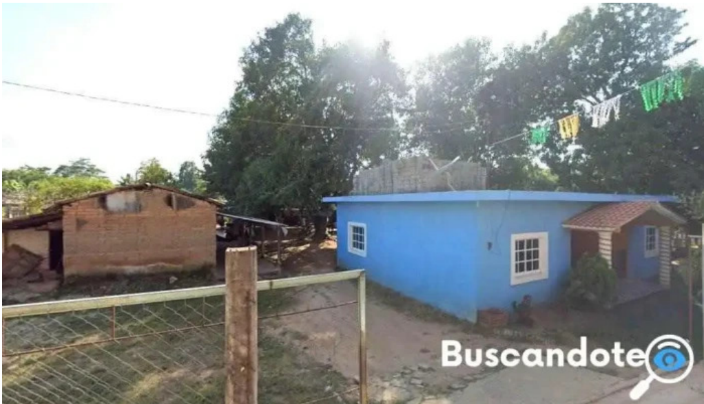
Unidad medica san agustin chayuco