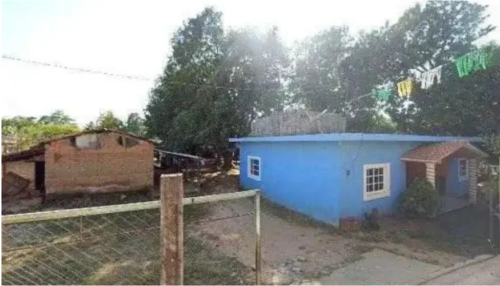
Unidad medica ubicacion