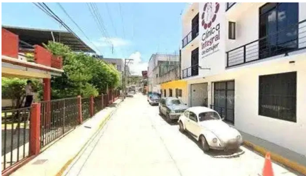
Clínica integral de la mujer fotos