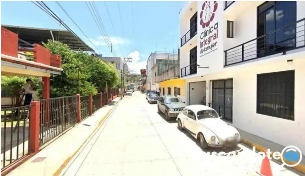
Clínica integral de la mujer putla villa de guerrero