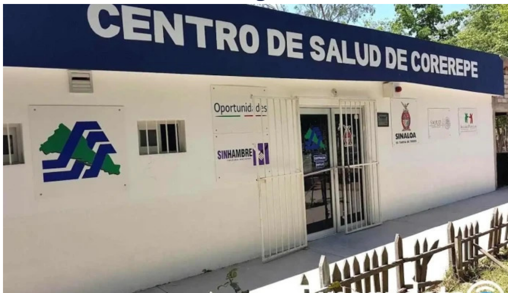
Centro de salud rural corerepe corerepe