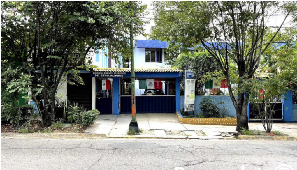
Consultorios medicos de especialidades zona