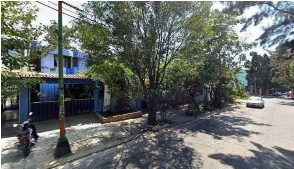
Consultorios medicos de especialidades zonadeg