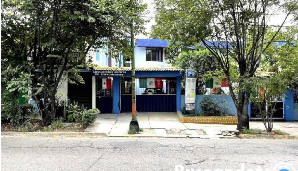
Consultorios medicos de especialidades oaxaca de juarez