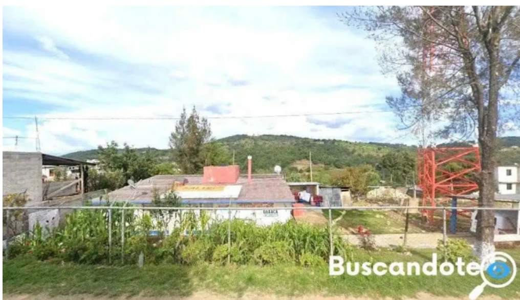
Centro de salud san miguel chichahua