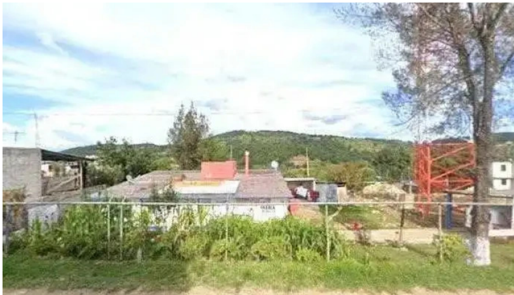
Centro de salud sitio web